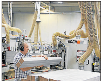
In die Ausweitung des Maschinenparks hat Multiprofil in den vergangenen Jahren investiert.